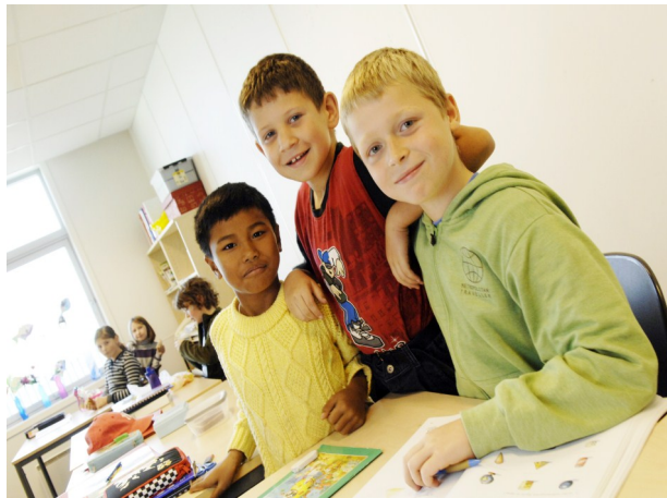
Elever fra Rogaland