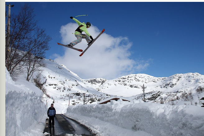
Skihopper, Sauda kommune