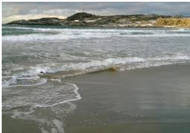
Hellestøstranden, Sola kommune

Rogaland blir ofte kalt et Norge i miniatyr fordi fylket har litt av alt når det gjelder landskap. Det er høye fjell og dype fjorder, landbruksjord og skog, fosser og stille vann, lange sandstrender og bratte svaberg, skikjøring og surfing.