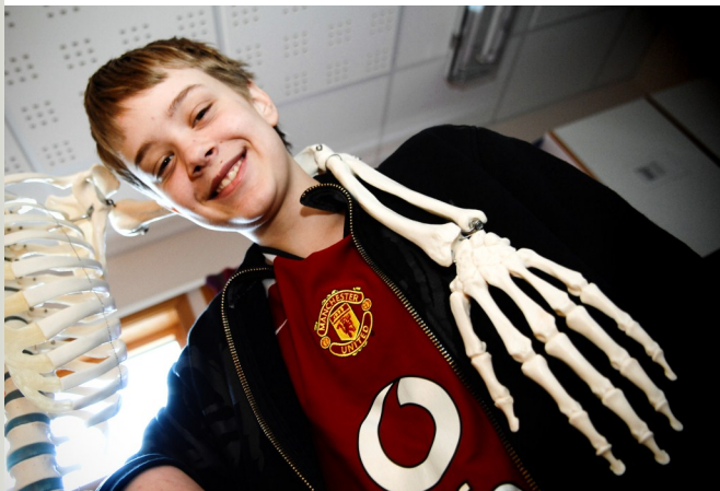
Elev, Stavanger kommune

Rogaland har aktive, interesserte, nyskapende og kreative skoleeiere som er opptatt av kvalitet i skolen for å stadig øke elevenes læringsutbytte. Det rehabiliteres og bygges nye skoler, og noen av våre kommuner er i kraftig vekst.